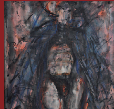
Figur und Zelt, Gouache, Farbstift, 61 x 42 cm, 1994, Ausschnitt