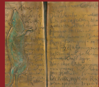
„Wir waren immer dabei...“ 1983, Relief, 40 x 32 cm, Ausschnitt