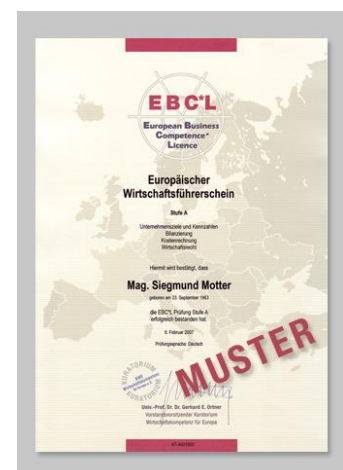
Muster: Wirtschaftsführerschein Stufe A

Unter www.kursfoerderung.at können Sie Ihre individuellen Fördermöglichkeiten ganz einfach abfragen.