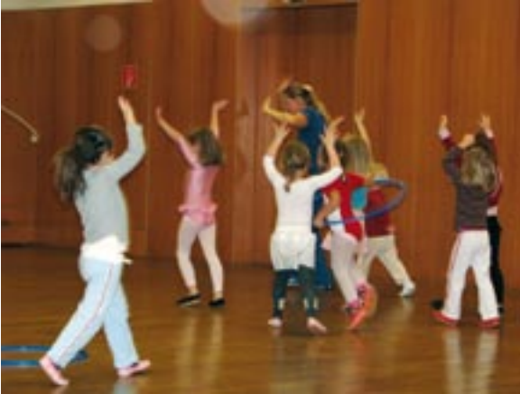
Konzentrierte Bewegung beim Ballettunterricht

Eine Alternative zum akuten Bewegungsmangel