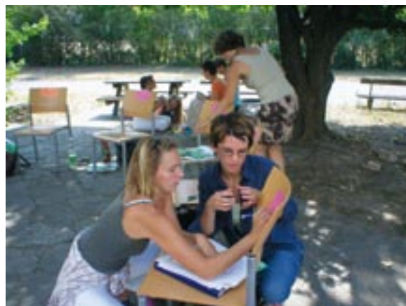
Im Sommer finden die Kurse auch im Garten statt.

Die Summer-Card wird auf Grund ihrer Beliebtheit auch im Sommer 2008 wieder aufgelegt. Mit nur einer Card – gültig für die Monate Juni, Juli, August und September – können wieder unzählige Konversationskurse in Englisch, Französisch, Italienisch und Spanisch, aber auch Bewegungskurse (Pilates, Yoga, Wirbelsäulengymnastik, Box-Aerobic) und nicht zu vergessen Tanzkurse (Karibische Tänze, Steptanz, etc.) besucht werden. Für unsere KundInnen, die während des Som-