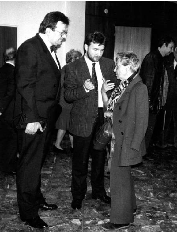
Dr. Michael Ludwig im Gespräch während einer Pause im Rahmen einer Vorstellung des Volkstheaters in den Außenbezirken – Mitte der 80er-Jahre