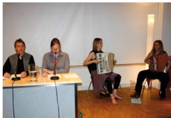
Die „Aeroflotten“ gestalteten das musikalische Rahmenprogramm