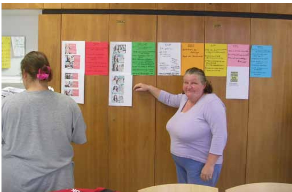
Politische Bildung in der Basisbildung vor der Gemeinderatswahl in Wien 2010

Eine Auseinandersetzung mit Diversität und Inklusion in der Basisbildung