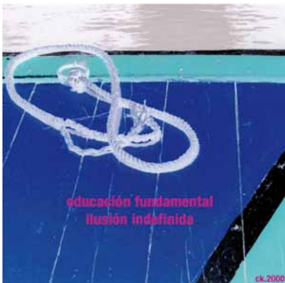
Ready Made Xochimilco 2000 (© Christian Kloyber)

[Literacy is a prerequisite for scientific and technical advance...]. Nor is Literacy necessarily to lead to democracy, or if it does so, to a right development of society. Nazi Germany demonstrated all too clearly the way in which one of the most thoroughly literate and highly educated peoples of the world could be led into false ways [...]; and in democratic countries the manipulations of the press [...] Again, knowledge may easily be incomplete and information distorted, and these are among the most potent sources of international ill-will. 4